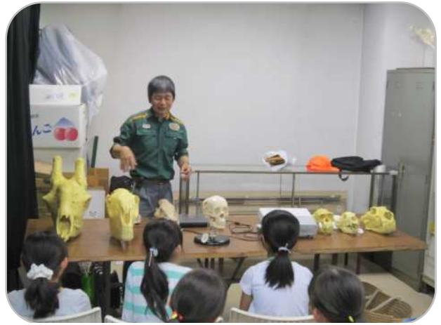
頭骨の形とエサの関係を学びました。いろいろな個性的な骨の形があることが印象に残りました。