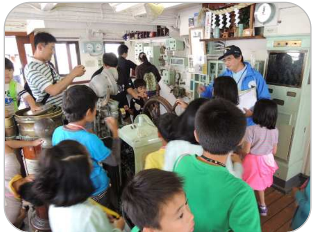
ブリッジでは、いろいろな計器が何に使われていたのか、説明を聞きました。