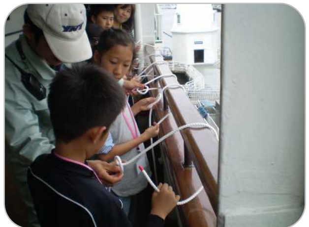
簡単にほどけるけど丈夫な結び方など、いろいろなロープの結び方を教わりました。覚えられたかな？