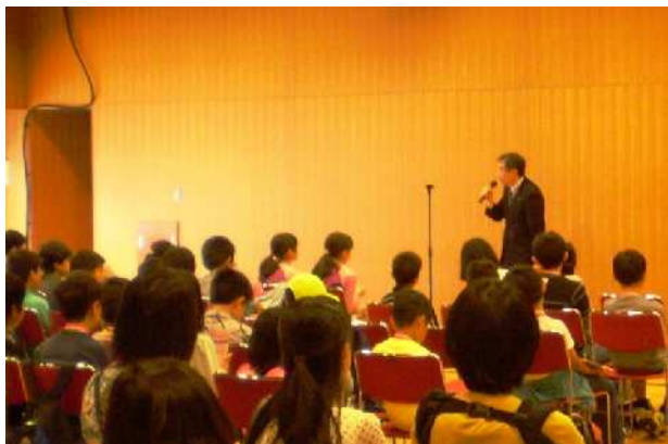
あいさつの中で、「ぜひ探検に行く前に、少し調べてみて、どんどん質問をしましょう」と話されました

子ども科学探検隊は協議会主催による事業で、会員の皆様の博物館や企業、大学研究室を訪問し、普段は見るできないところを見学させていただいたり、科学体験やものづくりをさせていただいたりする事業です。