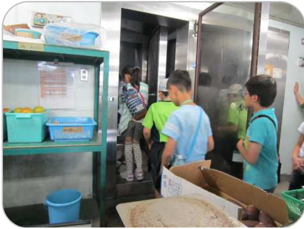
動物たちのエサの貯蔵庫に入れてもらいました。いろいろな種類のエサがたくさんありました。