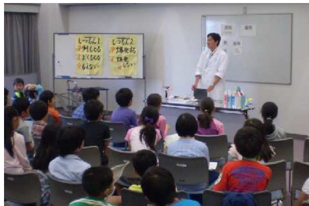
3コースの参加者60名が一同に集まり、燃焼と爆発の実験ショーを楽しみました