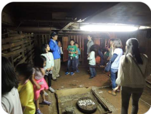
普段は非公開で入ることのできない、艦底に近い冷蔵庫にも案内していただきました。