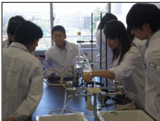
日本大学生物資源科学部にて 植物から香り成分を取り出す実験