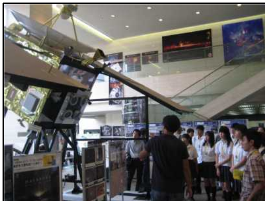
宇宙航空研究開発機構(JAXA)にて 「はやぶさ」の模型を見学