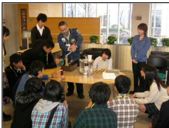
海洋研究開発機構にて 深海での水圧の実験