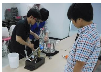
三菱みなとみらい技術館・実験