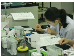
日本大学・サイエンススクール