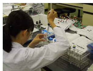
日本大学 バイオサイエンス