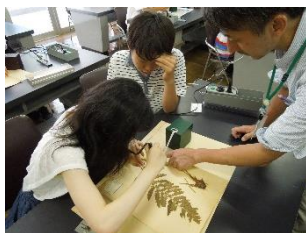
横須賀市自然史博物館・仕事体験