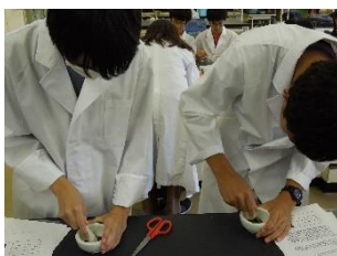
湘南工科大学・食品成分分析