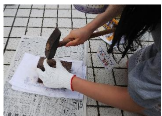
生命の星・地球博物館・化石観察