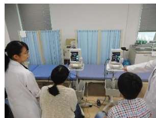
桐蔭横浜大学・医療系技術者体験