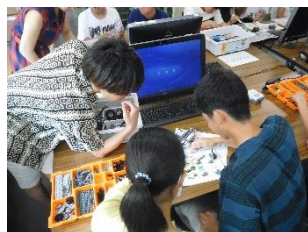
青山学院大学・ロボット制御