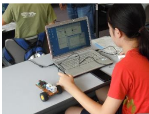
東京工芸大学・ロボット制御