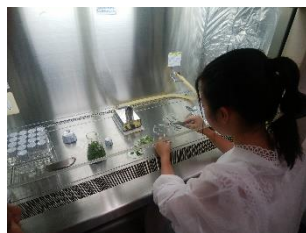
麻布大学・水生生物の組織培養