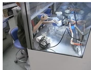
神奈川工科大学・植物バイオ

写真・内容等は2019年度に実施したものです。今年度の内容は、科学部ホームページ「インターネット科学館」に随時掲載しますので、お申込み前にご確認ください。