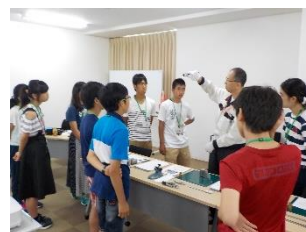
ミットヨ測定博物館・測定体験