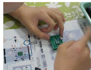
東芝未来技術館・光通信のしくみ