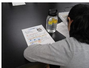
東海大学・ガリレオ温度計