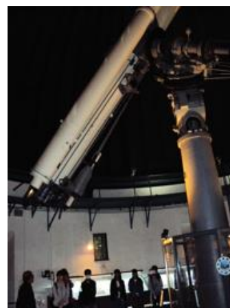
昨年度の講座の様子