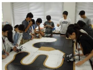
青山学院大学・ロボット制御