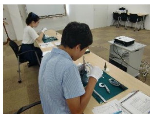
ミットヨ測定博物館・精密測定