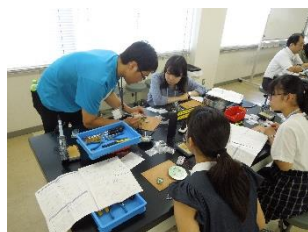
湘南工科大学・電子工作体験