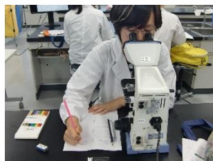
麻布大学・血液塗抹標本の作成