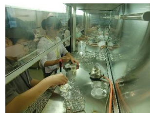
神奈川工科大学・植物バイオテクノロジー