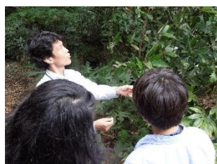
馬堀自然教育園・テラリウム作り