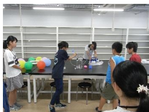
東海大学・身の回りの不思議