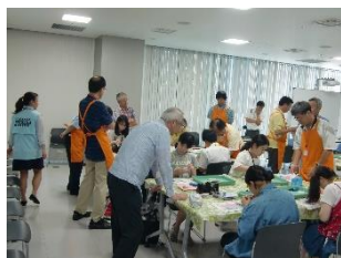
東芝未来技術館・トランシーバ作り