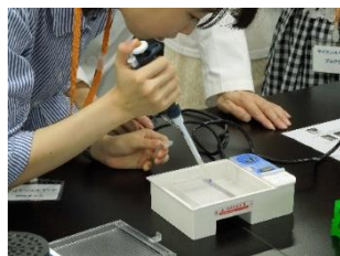
横浜薬科大学・DNA 実験