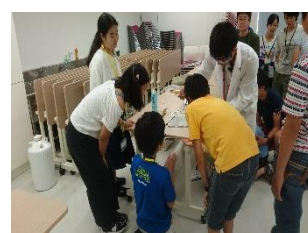
三菱みなとみらい技術館・理科実験