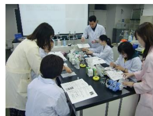
日本大学・バイオサイエンス