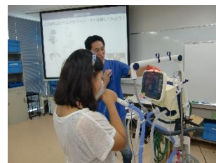
桐蔭横浜大学・医療技術者体験